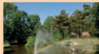
Limburg; onvergetelijk en mooi!