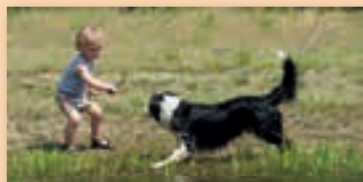
Overijssel; fantastisch en gemoedelijk!