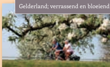
Gelderland; verrassend en bloeiend!