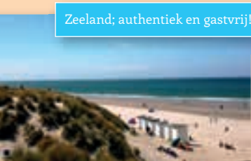
Zeeland; authentiek en gastvrij!