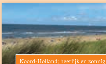
Noord-Holland; heerlijk en zonnig!