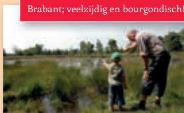
Brabant; veelzijdig en bourgondisch!